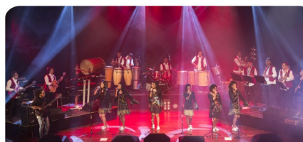
Banda dos Curumins con Pipoquinha